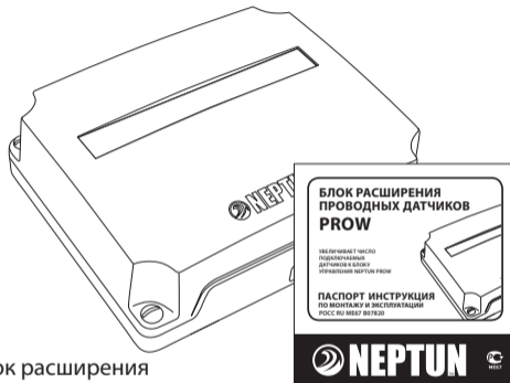
Блок расширения проводных датчиков ProW