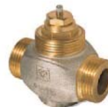
Регулирующий клапан 7760 проходной формы

Регулирующий клапан для зонального регулирования в системах отопления, вентиляторов-конвекторов, воздушных отопителей в связке с термоприводом ГЕРЦ 7711. Номинальное давление 16 бар, размеры от DN10 до DN20. Равнопроцентная