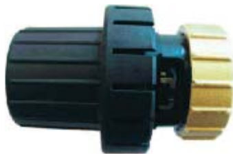
ручной привод для трехходовых регулирующих клапанов ГЕРЦ арт. 1 9102 40

Шпиндель клапана соединяется с приводом автоматически и жёстко. Латунный конус совершает равнопроцентное регулирование расхода на регулируемом участке. Чтобы компенсировать дополнительную характеристику потребителя (теплообменника) и обеспечить равное количество теплоносителя вне зависимости от положения клапана подмешивающий ход клапана работает по линейной характеристике. Это сочетание исключает так же и вибрацию конуса в крайних положениях и одновременно снижает кавитацию и эрозию. Так как сила пружины не противодействует при закрытии клапана, то в пределах допустимого перепада давления сила привода может использоваться в полной мере. Герметичность регулирующего хода клапана обеспечивается обработкой седла и уплотнением конуса из армированного стекловолокном тефлона. Сальник клапана не требует обслуживания и состоит из