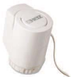
Привод с плавным регулированием 7711

При использовании привода с плавным регулированием 7711 клапан может принимать любое необходимое положение. Плавное регулирование осуществляется управляющим напряжением от 0 до 10 В. Через красный кабель подаётся напряжение