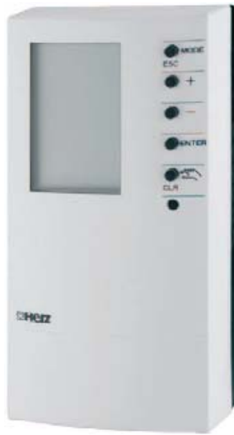
Регулятор 7791, 7793 или 7794

Регулятор 7793 - это компактный регулятор нагрева, который может эксплуатироваться с учетом наружной и внутренней температуры. В зависимости от применения происходит