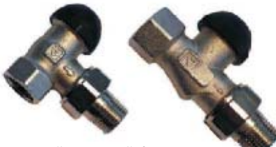
проходной и угловой формы

Полное отсутствие потерь на утечки. Регулирование по зонам с положениями клапана открыто/закрыто для систем отопления, вентиляторов-конвекторов, воздушных отопителей, в связке с термоприводом ГЕРЦ 7711. Номинальное