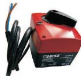
СЕРВОПРИВОД 7712 ДЛЯ ТРЁХХОДОВОГО СМЕСИТЕЛЬНОГО КЛАПАНА ИЛИ РЕГУЛИРУЮЩЕГО ШАРОВОГО КРАНА

Смесительный привод устанавливается на клапан с помощью единственного винта. Поставляемый упорный болт служит ограничения поворота. Привод можно устанавливать на клапан с поворотами на 90° относительно его корпуса. Благодаря своей компактности, этот сервопривод как правило, устанавливается в разрезе термоизоляции арматуры. Угол поворота ограничен до 90°. При достижении конечных упоров привод отключается. При возможных нарушениях в системе электронного регулирования привод можно перевести в режим ручного управления с помощью поворотной рукоятки на корпусе. При этом сам привод выходит из зацепления, а позиционирование смесителя осуществляется маховичком, находящимся на корпусе привода. Положение смесителя будет видно на поворотной шкале.