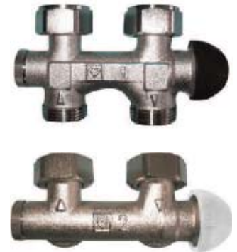
Узел подключения HERZ-TS-3000-Н

Присоединительная арматура ГЕРЦ-TS-3000-Н со встроенным термостатическим клапаном, имеющим преднастройку, изготавливается как проходной, так и угловой формы, особенно удобна для проведения предмонтажных работ и характеризуется компактной и уточнённой формой.