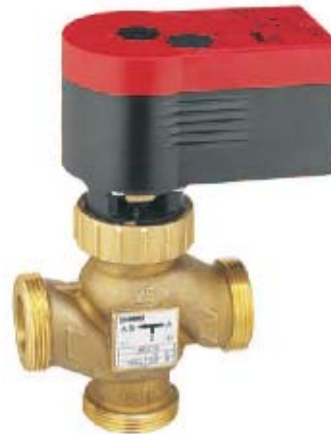
трехходовой регулирующий клапан с сервоприводом

Клапан имеет наружную резьбу согл. ISO 228-1, корпус клапана и седла из DR (устойчивой к цинковой коррозии) литой латуни, шпиндель из нержавеющей стали, конус из DR латуни с уплотнением из армированного стекловолокном тефлона, уплотнение шпинделя из DR латуни с двумя O-