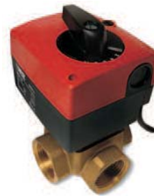
трехходовой смесительный клапан с сервоприводом

Смесительный кран с резьбовым присоединением, способствует энергоэффективной работе. Для 3-х позиционного регулирования по температуре подачи в системах отопления и тепло-снабжения. Номинальное давление 10 бар, размеры от DN15 до DN50. Корпус и шибер из латуни CW617N. Двойное O-Ring уплотнение из EPDM гарантирует герметичность на шпинделе. Максимальная рабочая температура 130 °C.