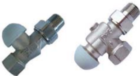
проходной и специальной угловой формы

При вдавливании шпинделя клапан закрывается. Возврат в исходное положение происходит за счёт усилия пружины. Клапан может управляться термоприводом 7711 с возможными положениями открыто/закрыто.