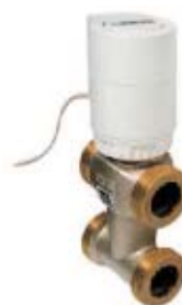
ТРЕХХОДОВОЙ РЕГУЛИРУЮЩИЙ КЛАПАН 7763 с термоприводом и байпасом

Регулирующий клапан для зонального регулирования в системах отопления, вентиляторов-конвекторов, воздушных отопителей и двухтрубных систем с теплообменниками, в