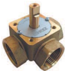
ТРЕХХОДОВОЙ РЕГУЛИРУЮЩИЙ КЛАПАН

Для автоматического регулирования пригодны реверсивные сервоприводы 7712 с углом поворота 90°. После вывода привода из зацепления, шибер можно настраивать вручную.