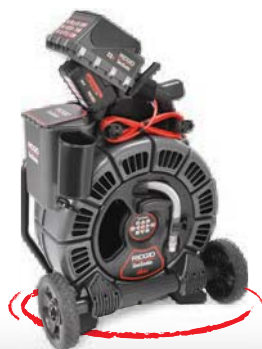
SeeSnake® MAX rM200 и CS6

Для инспекции труб малого и среднего диаметра от 40 до 150 мм / 200 мм