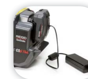
Переходник переменного тока (опционально)