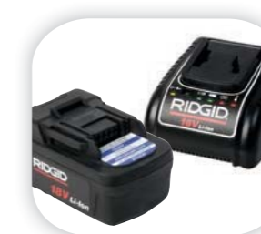
Аккумулятор 18 В Advanced Lithium 4.0