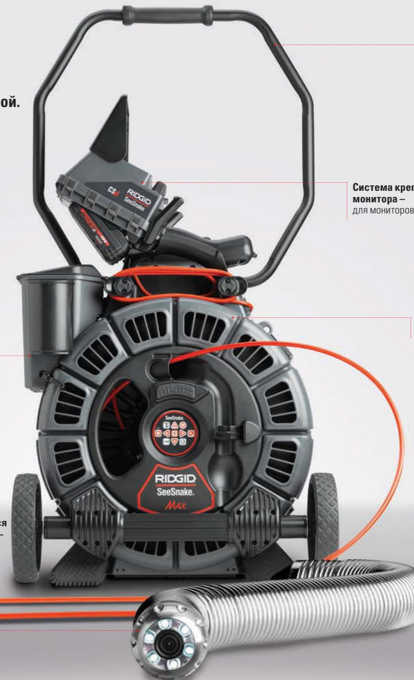
Встроенная тележка – включая ручку и ремень для более простой транспортировки

Монитор CS6Pak имеет те же характеристики, что и CS6 и совместим со всеми барабанами SeeSnake®. CS6Pak разработан для крепления на барабан Compact 2, а CS6 легко монтировать на ручку крепления SeeSnake® MAX rM200.