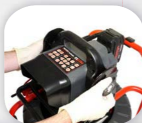
Ручка – для переноски всей системы видеодиагностики в одной руке