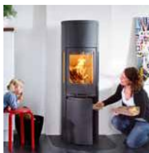
Камины на древесном топливе (листовой металл)