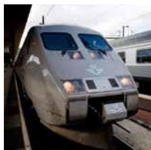
Средства передвижения и транспорт