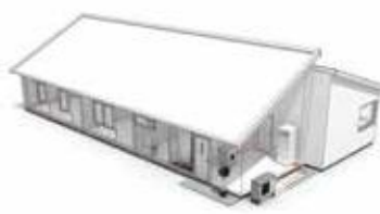
Воздушные/водяные тепловые насосы