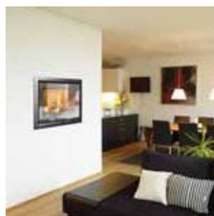
Вкладки для сжигания древесного топлива