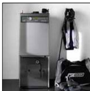
Котлы для домов и горелки для пеллетса