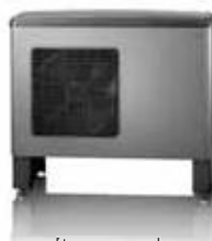
Воздушные/водяные тепловые насосы