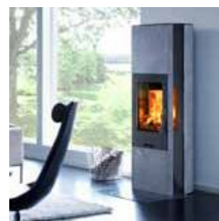
Камины на древесном топливе (собрамением)