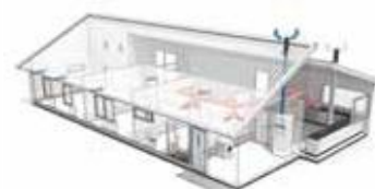
Тепловые насосы выходящего воздуха