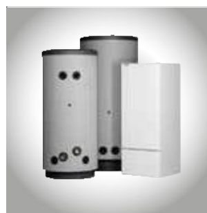
Водонагреватели и накопители