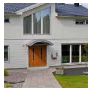
Комфорт - вода