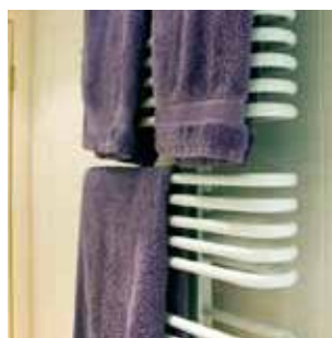
Комфорт - воздух