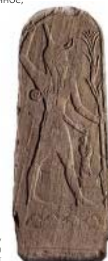
Лувр, Франция, стелла бога Балу (позднее Баал, общесемит. – хозяин, владыка) XIII-XV вв. до н.э., Древний Угарит