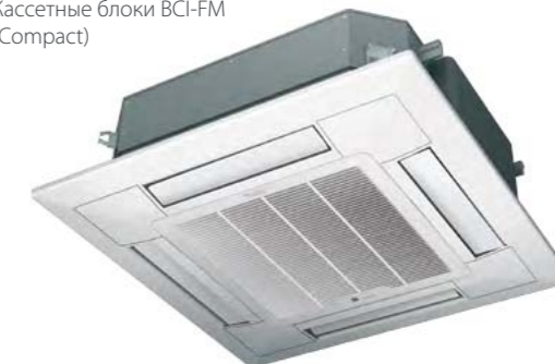
Кассетные блоки BCI-FM (Compact)