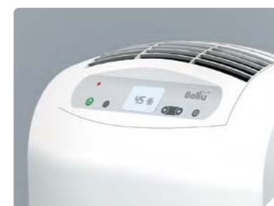
Панель управления режимами и функциями