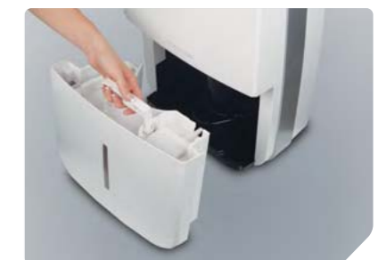
Бак для сбора конденсата с ручкой (5 л.)