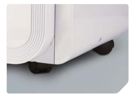
Удобные ножки на колесиках