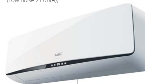
Настенные блоки BSEI-FM (Low noise 21 dB(A))