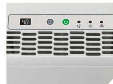
Панель управления BDH-15L