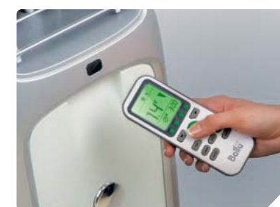
Эргономичный пульт с режимом реального времени