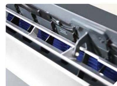
Автоматические горизонтальные и вертикальные жалюзи