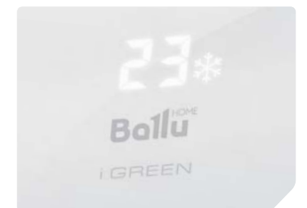
Высококонтрастный интерактивный LED-дисплей скрытого типа