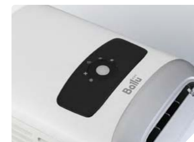
Интеллектуальное управление ONE TOUCH