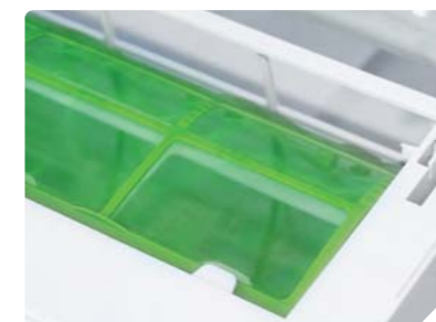
Воздушный фильтр высокой плотности