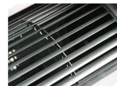
Статическое давление до 160 Па позволяет организовывать кондиционирование нескольких помещений