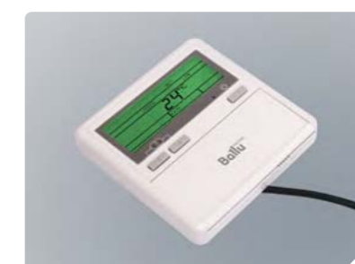
Оptionальный проводной пульт управления