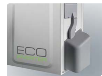
Защитная накладка на вентили наружного блока