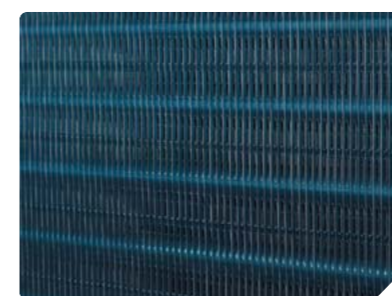
Покрытие Blue Fin защищает теплообменник от коррозии и продлевает срок службы в три раза