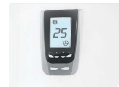
LED-дисплей с индикацией температуры