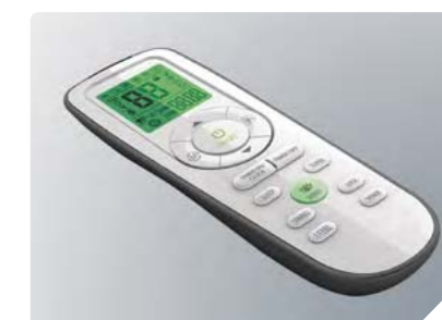
Эргономичный пульт управления