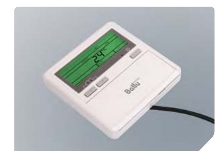
Оptionальный проводной пульт управления