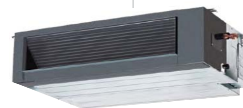
Канальные блоки BDI-FM (Super Slim 19 см)