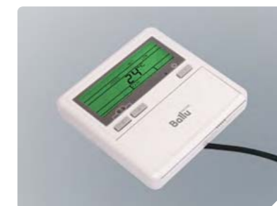
Оptionальный проводной пульт управления