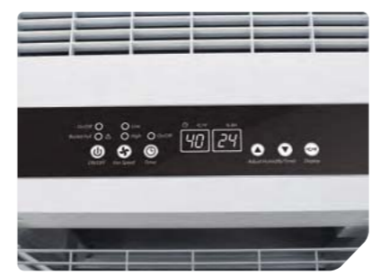
Панель управления режимами и функциями