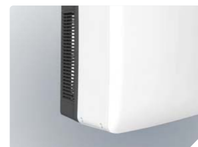
Шумопонижающая конструкция воздухозаборника