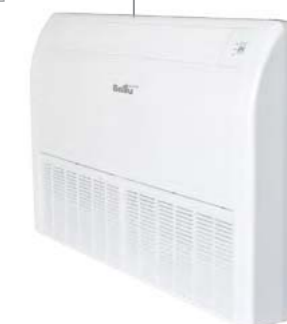
Напольно-потолочные блоки BCFI-FM (Double swing)