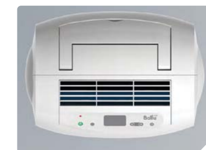
Контроль уровня влажности