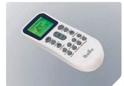
Эргономичный пульт управления