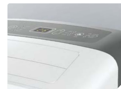
Интеллектуальная панель управления