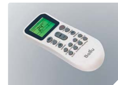
Эргономичный пульт управления