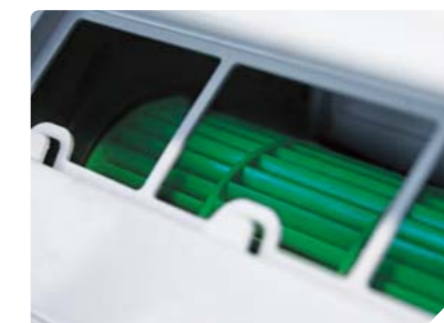
Вентилятор внутреннего блока из экологически чистого пластика