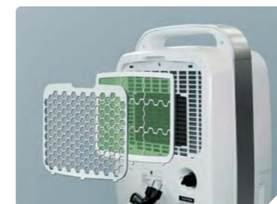
Многоступенчатая система фильтрации воздуха (грубая и тонкая очистка)