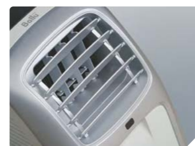
Регулировка направления воздушного потока в 4-х направлениях