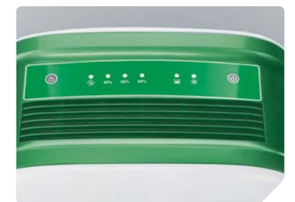
Панель управления BDH-20L