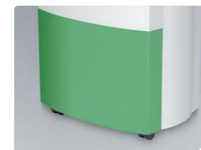
Вместительный бак для сбора конденсата