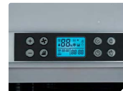
Панель управления режимами и функциями