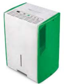
Компактная модель BDH-15L