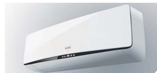
Альтернативное цветовое решение