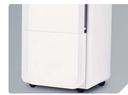
Вместительный бак для сбора конденсата