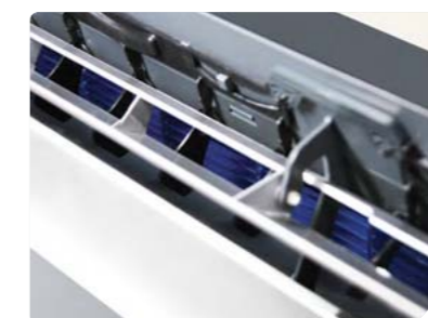
Автоматические горизонтальные и вертикальные жалюзи