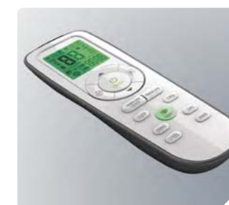
Эргономичный пульт управления