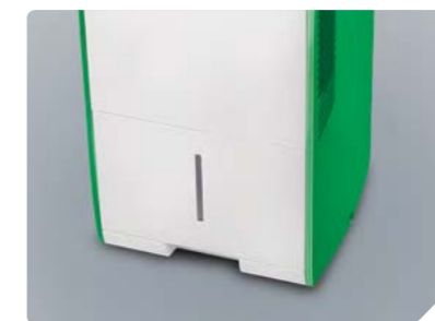
Бак для сбора конденсата