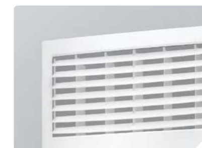
Широкий воздушный поток