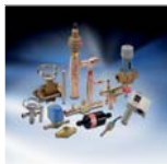
Регуляторы коммерческих холодильных установок

ние на качество наших изделий, компонентов и систем, которое является основой повышения эффективности работы и снижения производственных затрат – ключевым фактором экономии финансовых средств.