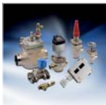
Регуляторы промышленных холодильных установок