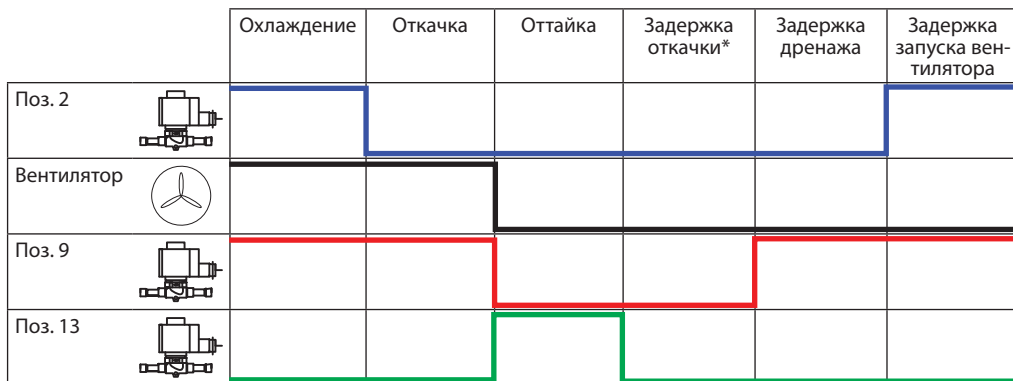
Рис. 2 Циклограмма процесса оттайки.

* В режиме «Задержка откачки» соленоидные клапаны поз. 2, 9, 13 закрыты. Байпасный соленоидный клапан на линии всасывания поз. 10 открыт.