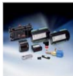
Электронные регуляторы и датчики