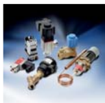
Компоненты промышленной автоматики