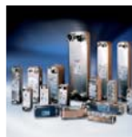
Паяные пластинчатые теплообменники

Мы являемся единственным производителем высокотехнологичных компонентов для холодильных установок и систем кондиционирования воздуха самой широкой номенклатуры. Мы предлагаем передовые технические и деловые решения, которые могут помочь Вашей компании снизить затраты, модернизировать производство и обеспечить выполнение поставленных задач.