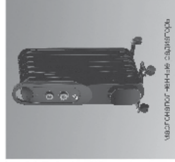
магнитные инертные обогреватели