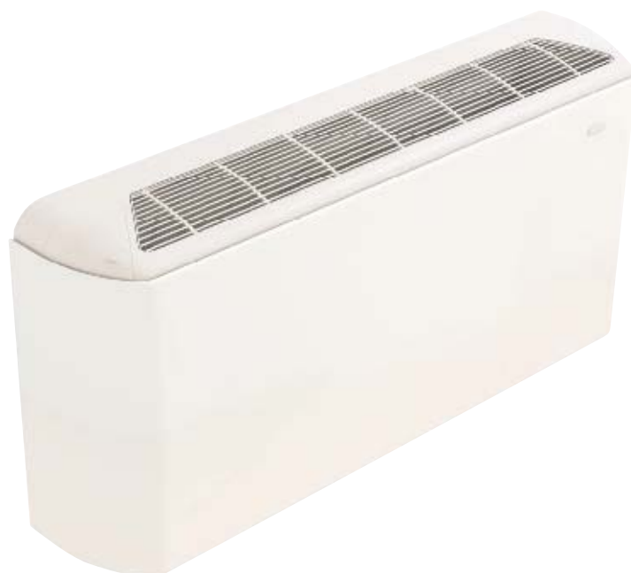
Рис. 6. Вертикальный фэн-койл MFU