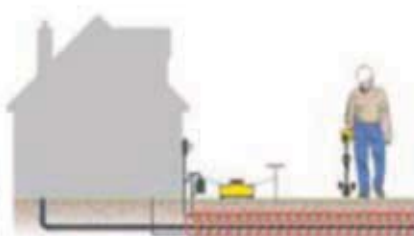
Обнаружение с помощью линейного передатчика (прямое подключение).