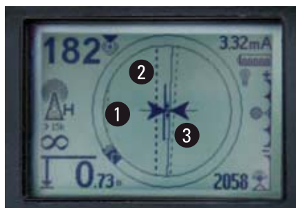
Экран в режиме Omniseek: Отображаются несколько линий (на фотографии показаны три разные коммуникации) 1, 2, 3.