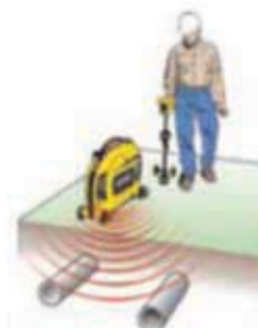
Обнаружение с помощью линейного передатчика (индукционный режим)