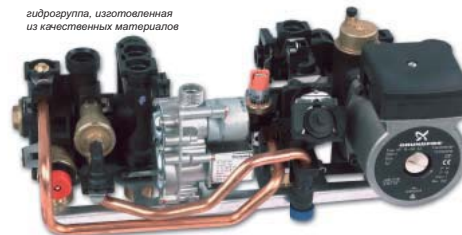
гидрогруппа, изготовленная из качественных материалов

Разработка и производство котлов «PROTHERM» сертифицированы в соответствии с международным стандартом качества ISO 9001.