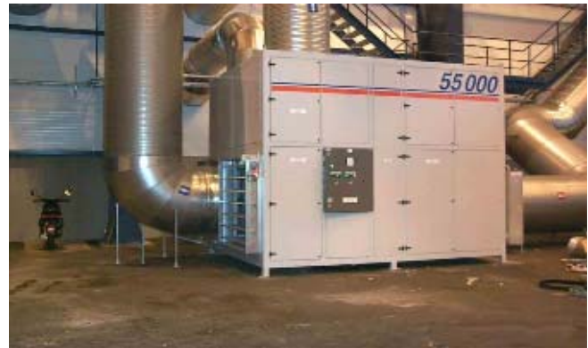
Склад металлических изделий. Осушитель DT55000 с воздушным потоком 55 000 м 3 /ч

Влага является наиболее важным фактором окружающей среды при хранении продукции и сырья. Если относительная влажность является высокой, железо и сталь корродируют, ткани плесневеют, а в электронном оборудовании возникают функциональные неполадки. Относительная влажность, которая никогда не превышает 50%, является наилучшей гарантией для хранимых грузов и материалов от повреждений, вызываемых окружающей средой.