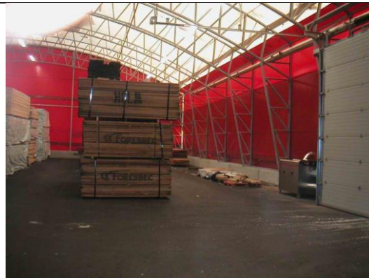
Склад деревообрабатывающего предприятия, Швеция