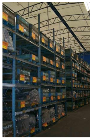
Склад стальных изделий и запчастей. Легкая конструкция.