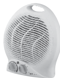
FH - 04 220V 50Hz 2000W