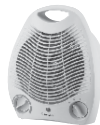
FH - 03 220V 50Hz 2000W