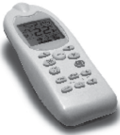
Dimensioni (mm) / Dimensions (mm)