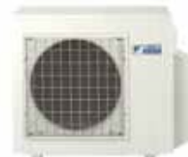
Наружный блок RXS20,25K