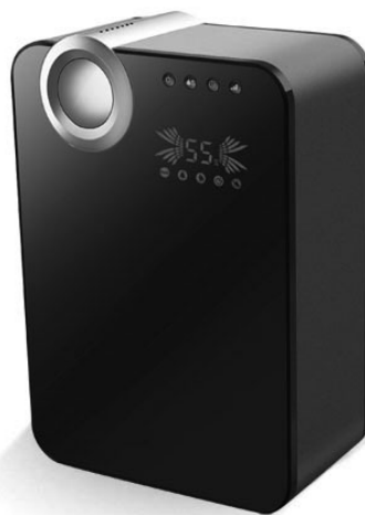
Модель D-H50UCF-W D-H50UCF-B