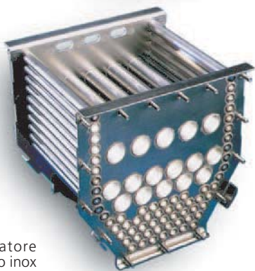
Scambiatore in acciaio inox (brev.)