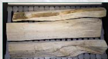
Древесина длиной 330-530 мм