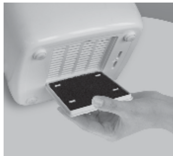
Рис. 9 Фильтр очистки воздуха Pre-filter

Воздух может содержать в себе различные примеси, которые могут при дыхании попадать в дыхательные пути человека или оседать в приборах. Фильтр очищает воздух от крупных фрагментов пыли, шерсти и защищает внутреннюю часть прибора и комплектующие от пыли и прочих примесей.