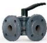
HFE 3 Регулирующие поворотные клапаны, чугунные, фланцевые