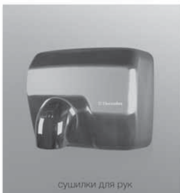
сушилки для рук