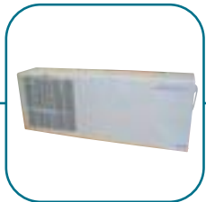
Консольный моноблок стр. 72