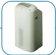
Мобильные кондиционеры стр. 74