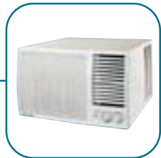
Оконные кондиционеры стр. 75