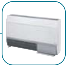
Консольные с водяным охлаждением конденсатора стр. 73