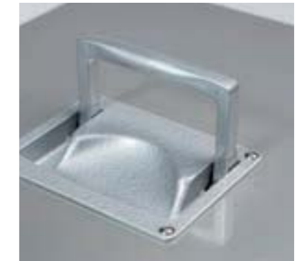
Осушители серии AD B разработаны в расчете на простоту эксплуатации и транспортировки. Утопленные ручки очень удобны для транспортировки агрегата на объекты для оперативного осушения.

новых зданий и зданий, пострадавших в результате затопления, осушения воздуха в жилых и складских помещениях, на водопроводных и водонапорных станциях.