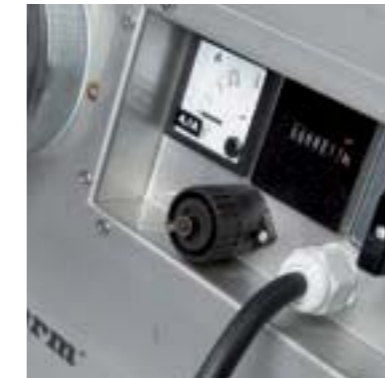
Простая панель управления со счетчиком времени наработки и подключаемым гигростатом. Панель управления устанавливается заподлицо и имеет надлежащую защиту.