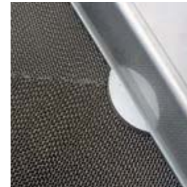
Когда ротор находится в осушаемой зоне, он впитывает влагу силикагелевой поверхностью. В зоне регенерации влага высвобождается, и ротор снова может поглощать влагу при выходе в зону осушения.