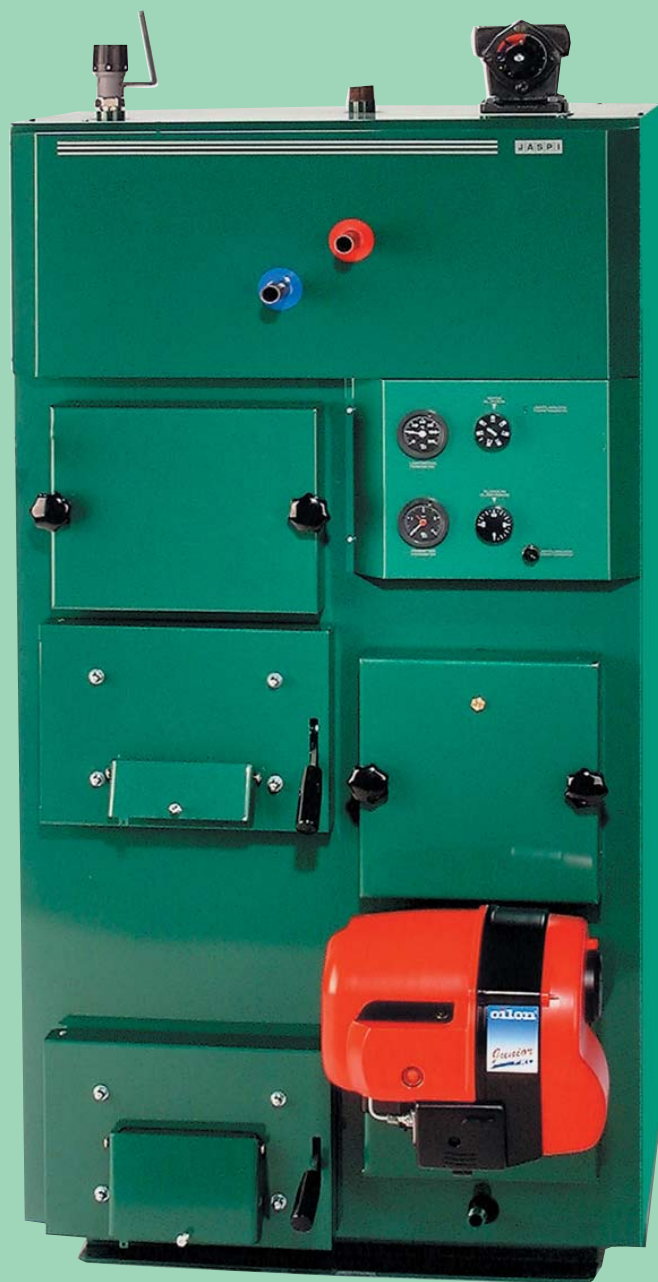
Горелка на фото не входит в стандартную поставку

При разработке и изготовлении использованы новейшие технологии в данной области, результатами которых является надежный в работе, прочный и долговечный котел с высоким к.п.д., который является верным выбором ценящего качество клиента.