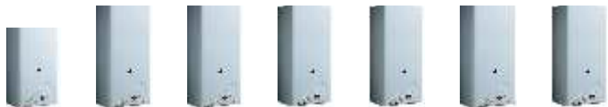
ТАБЛИЦА ТЕХНИЧЕСКИХ ХАРАКТЕРИСТИК