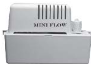
Mini Flow - MF200W, MF300W, MF400W