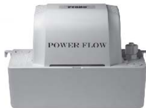
Power Flow - PF400, PF600, PF800