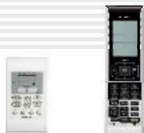
SPX-RCDB (опция) RAR-5E2 (стандартно)